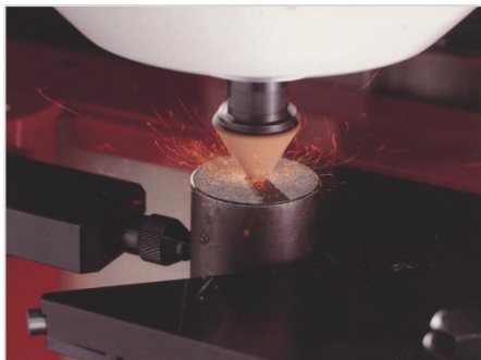
センター穴研削盤 YCG-1215