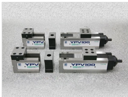
コンビネーションバイス SB-80 SB-100 SB-125 CB-80 CB-100 CB-125