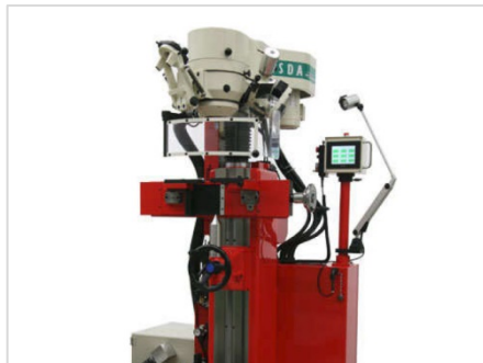
セミオートマチックセンター穴研削盤 YGC-1215 CNC