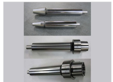
テストバー(木箱付き) BT40 BT50 HSK-A63